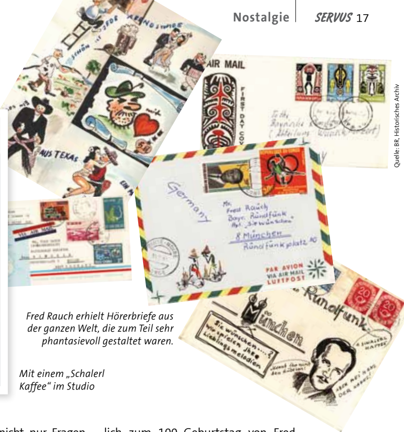
Fred Rauch erhielt Hörerbriefe aus der ganzen Welt, die zum Teil sehr phantasievoll gestaltet waren.