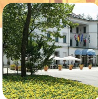
Grand Hotel Riolo