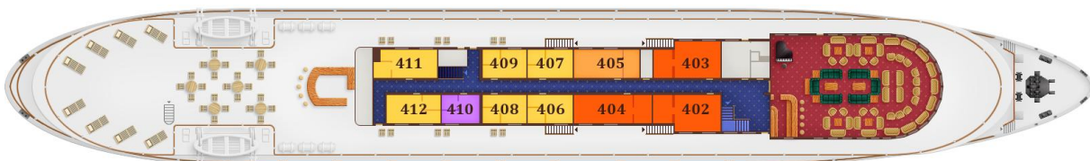
Sonnen-Deck (gelb = Superior-Kabinen)