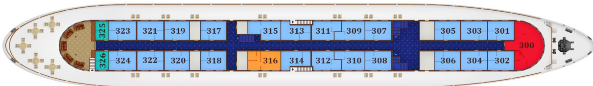
Promenade-Deck (blau = Deluxe-Kabinen)