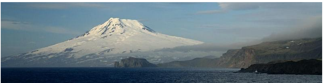
Jan Mayen mit dem Beerenberg