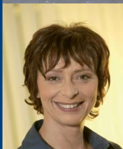
Bayern 1-Moderatorin Conny Glogger