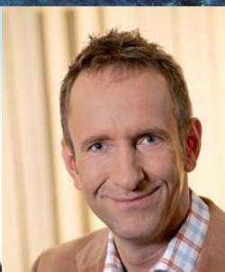
Bayern 1-Moderator Tilmann Schöberl