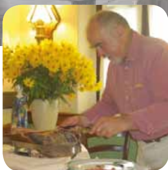
... in der Osteria