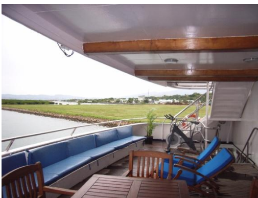
Freifläche auf dem Lounge Deck