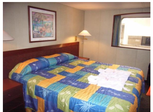
Kabine auf dem Lounge Deck