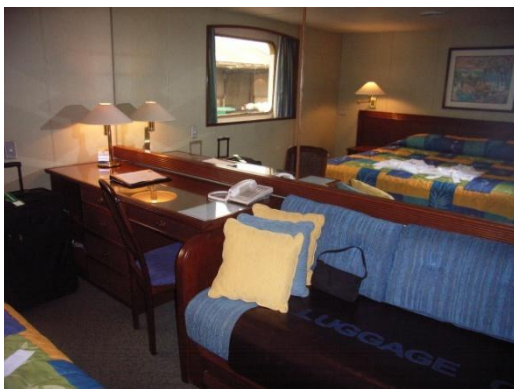
Kabine auf dem Saloon Deck