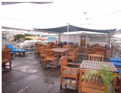
Freifläche auf dem Sky Deck