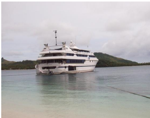
MV Mystique Princess

Eine kleine Bildergalerie finden Sie auf der Rückseite