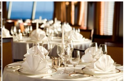
Oben und unten: Restaurant