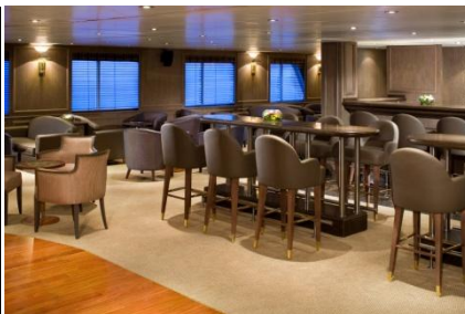
Oben: Panorama Lounge Unten: Observation Lounge