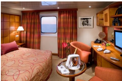
Oben: Kabine Explorer Class Unten: Internetcafé/Bibliothek: