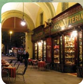
Caffè Platti - Turin