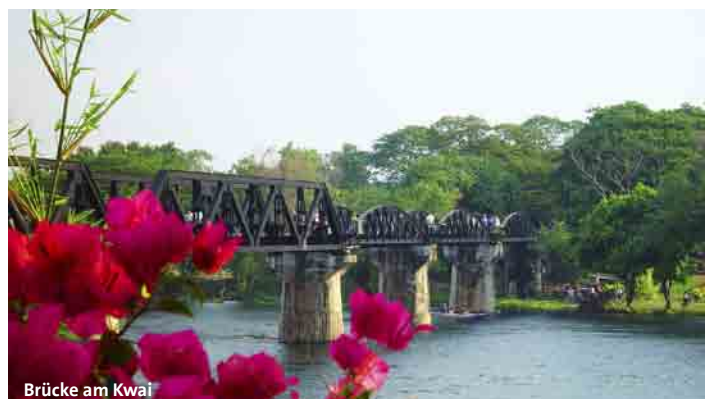
Brücke am Kwai