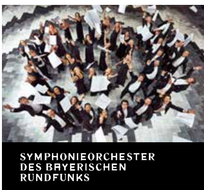
SYMPHONIEORCHESTER DES BAYERISCHEN RUNDFUNKS

Seit über 1.000 Jahren wandern Pilger auf dem bekanntesten Pilgerweg der Welt zum Grab des Apostels Jakobus in der spanischen Stadt Santiago de Compostela. Mit der BR-Kirchenredaktion machen wir uns von Bilbao aus über Pamplona, Burgos, León und La Coruña auf den Weg durch die landschaftliche und kulturelle Vielfalt des spanischen Nordens.