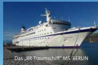
Das „BR-Traumschiff“ MS BERLIN