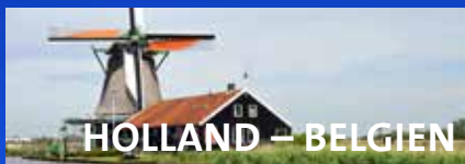
HOLLAND – BELGIEN

Wechselnde Landschaften mit Olivenhainen und Weinbergen, atemberaubende Panorama-Aussichten und idyllische Dörfer: die BR-Bergsteiger erschließen Korfu als perfektes Wanderparadies.